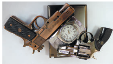
Зажигалки из коллекции

– Меня всегда удивляло, как Кингу удалось написать такое произведение. Весь сюжет на первый взгляд строится вокруг прогулки. И главные герои идут все время повествования. Казалось бы, ну что там еще писать, идут и идут... Но при этом книга читается очень легко и с интересом. Видимо, не зря именно «Долгая прогулка» до сих пор остается одним из самых ярких произведений в мировой литературе в плане раскрытия темы естественного отбора.