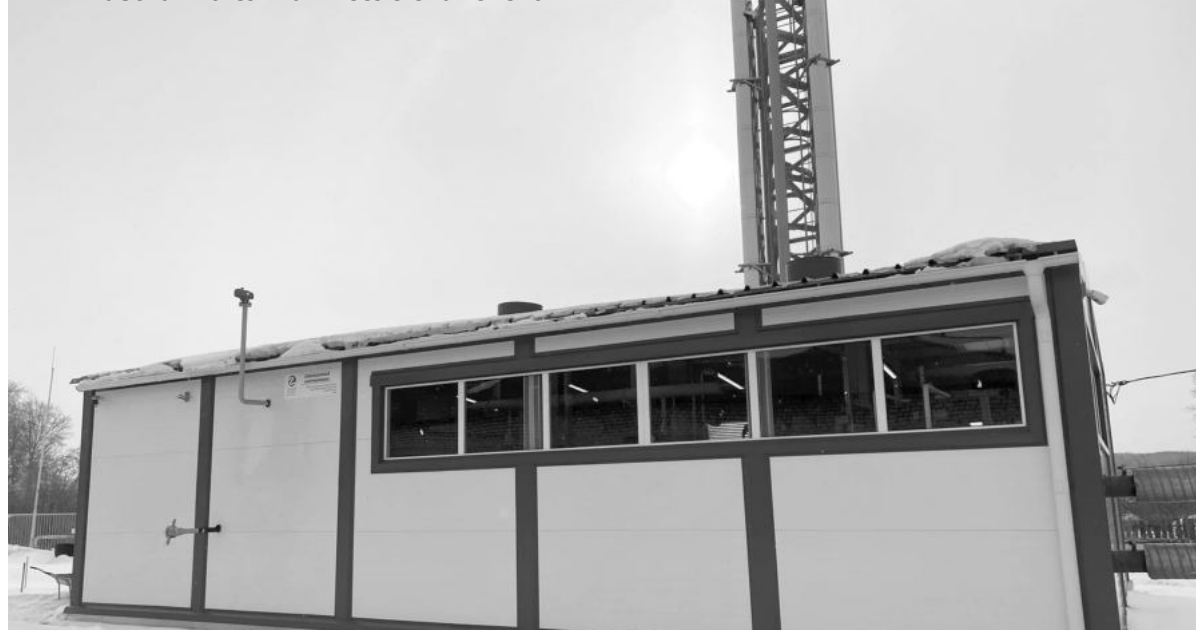
Газовая котельная в селе Знаменском

Вопросы от читателей задавала Ксения Малыгина